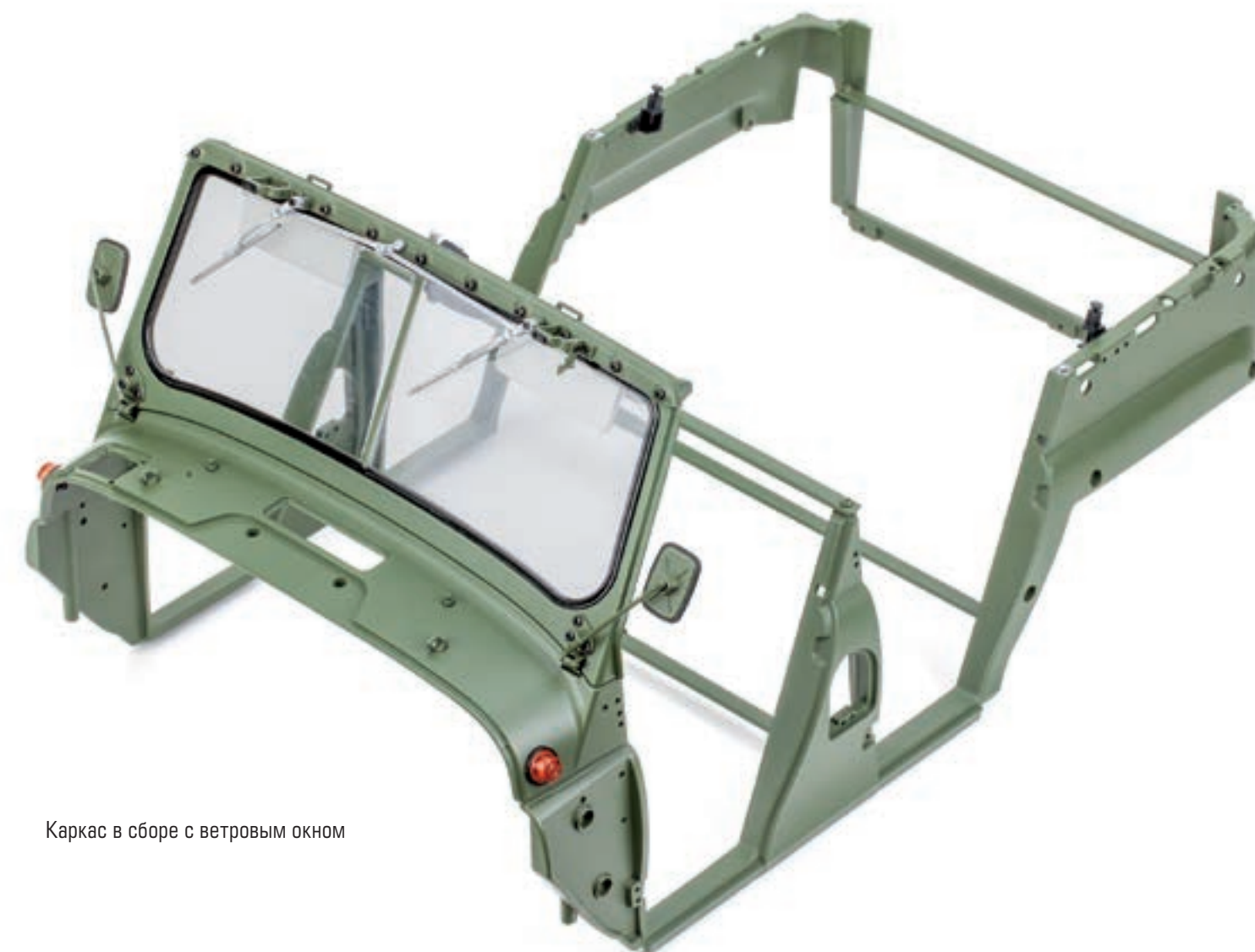
Каркас в сборе с ветровым окном